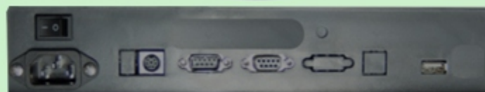
Interfaces PS2, RS-232, USB, MicroSD